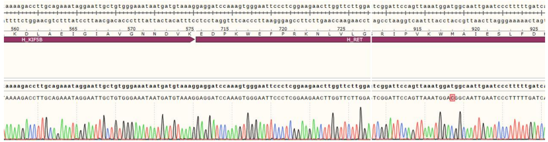
Fig 2. H_KIF5B-RET(M918T) BaF3 Cell Line 测序结果